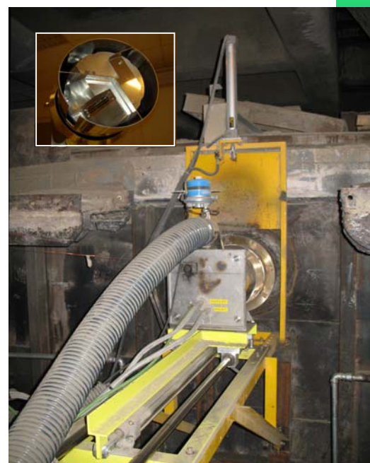
Assemblage sur site et détail de la tête