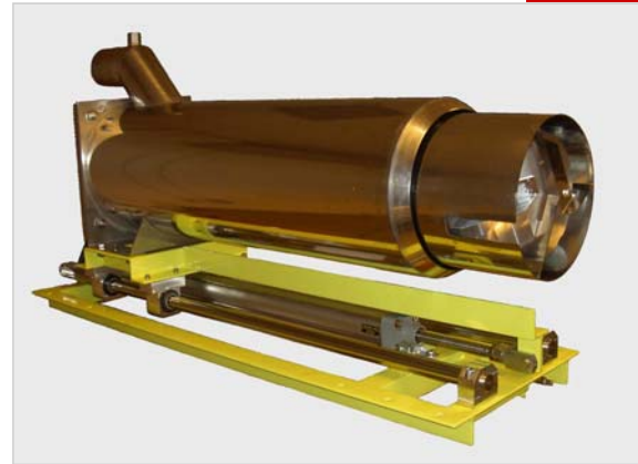
Vue générale du système

Un miroir tournant, combiné avec un guide de positionnement à indexage, produit une image thermique bi-dimensionnelle en temps réel. Le rayonnement thermique est concentré sur un capteur infrarouge monté dans une tête refroidie par eau. Le signal IR est traité par l'électronique afin de produire une image thermique calibrée du large champ de vue qui est visualisée sur l'écran PC situé dans la salle de contrôle. Dans le refroidisseur, le périscope est protégé des hautes températures et de l'abrasion par une enveloppe en Inox, ainsi que par un refroidissement par air. La fenêtre en saphir est résistante à la chaleur et à l'abrasion. Le système optique du scanner est actionné par un moteur DC sans balai de haute précision. L'ensemble est monté sur un rail pour extraction automatique en cas de surchauffe. Dans ce cas, le trou d'ouverture dans le mur du refroidisseur est obturé automatiquement par un tampon pneumatique.